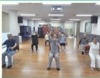
어르신 맞춤형 GX프로그램 '바른자세 · 바른백세 운동교실'