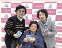
노인맞춤돌봄서비스 실로 이어진 사람들, '오손도손'