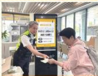
방배경찰서와 함께하는 교통사고 예방교육 및 캠페인

#주거환경개선사업 #지역사회 나눔봉사 #함께한지 10주년! #도배장판수리&청소 #덕분에 스위트홈