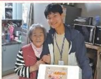
따뜻한 마음, 함께 나누는 김장김치의 정!