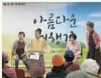
웰다잉재단 ‘아름다운 여행길’ 연극 공연