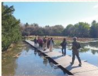
몸과 마음에 웃음꽃을 피우세요! '행복 비타민 충전! 나들이'