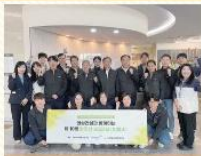
희상건설과 함께하는 제 10회 따뜻한 보금자리만들기

#화재! 꼼짝마라! #안심하고 이용하세요 #정기훈련으로 #어르신과 함께 만드는 #안전한 복지관