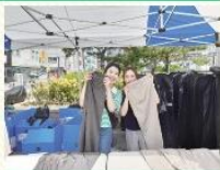
가을맞이! 다락多樂 방배 바자회