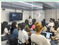
아산복지재단 공동체 네트워크 지원사업 ‘다시보기’