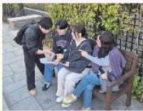
세대공감 프로젝트 '서초탐방단' 마을탐방활동

#어르신과 대학생이 #영상으로 남기는 #세대공감 콘텐츠! #우리동네 이야기채널로 #놀러주세요~ #방배글테레비 확인!