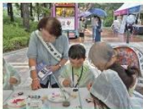
‘감탄!서포터즈’ 생활 속 탄소중립 실천 캠페인