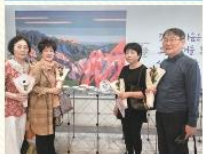
제 28회 노인의 날 맞이 노년사회교육 작품 전시회