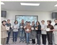
1·3세대 전통문화교류프로그램 '금상청화(靑華)' 중결평가회

#청화백자드로링 #1세대와 3세대가 함께하는 #금상청화(靑華) #내손으로 만드는 #나만의 작품