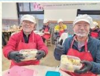
남성어르신 요리교실 '식(食)식(喰)한 함께'