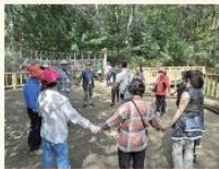
노인맞춤돌봄서비스, 시니어텔니스 산림치유사업 '나눔의 숲' 나들이