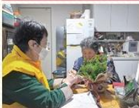
케어뱅크 연말맞이 '모루트리 만들기'