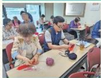
치매예방프로그램 '뉴런두런 시즌3'