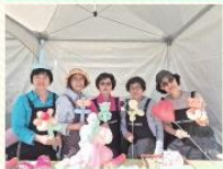
제 18회 전국노인자원봉사 대축제 ‘풍선아트봉사단’ 체험부스운영