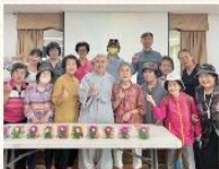
나 자신과 본인의 행복을 찾는 심리정서지원프로그램 '도반(道伴)' 종결평가회