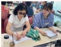
'우리동네 이야기채널 온화' 영상 콘텐츠 제작

#청화백자드로링 #1세대와 3세대가 함께하는 #금상청화(靑華) #내손으로 만드는 #나만의 작품