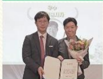
기관 15주년 기념행사 ‘참 좋은 인연’