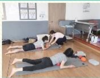
근골격계질환 특강 '굿볼 운동법'