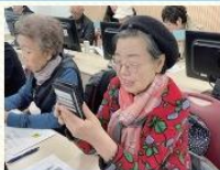
찾아가는 시니어 디지털 스쿨